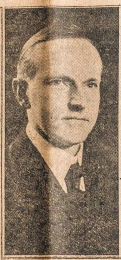
Naujasai Jungtinių Amerikos Valstybių prezidentas, Calvin Coolidge.

Trieste (Europoj), buvo kalba kiek galima žmogui išbuti be miego. Tad du jaunikaičiu nutarė lenktyniotis, kuris ilgiau išlaikys. Laimėtojas išbuvo 97 valandas ir 50 minučių be miego.