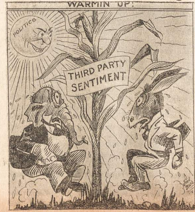
Trečiosios partijos sentimentas.

Amerikos elektrikos, gazo, telefonų, gatvėkarių ir t. t. kompanijos samdo 1,000,000 darbininkų. Į tas kompanijas (Public Utilities) investyta 15,000,000,000 dol.