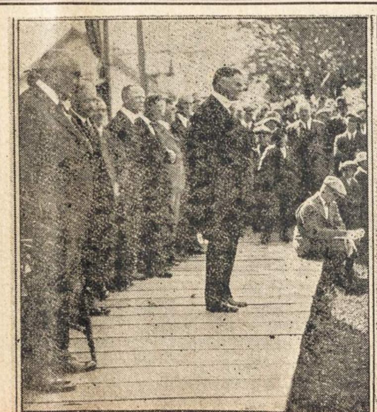
Valstybių Komercijos Sekretorius, H. Hoover, kalba Alaskos mieste Wrangell. Kalbėtojo kairėj stovi prezidentas Hardingas, kuris dabar serga.