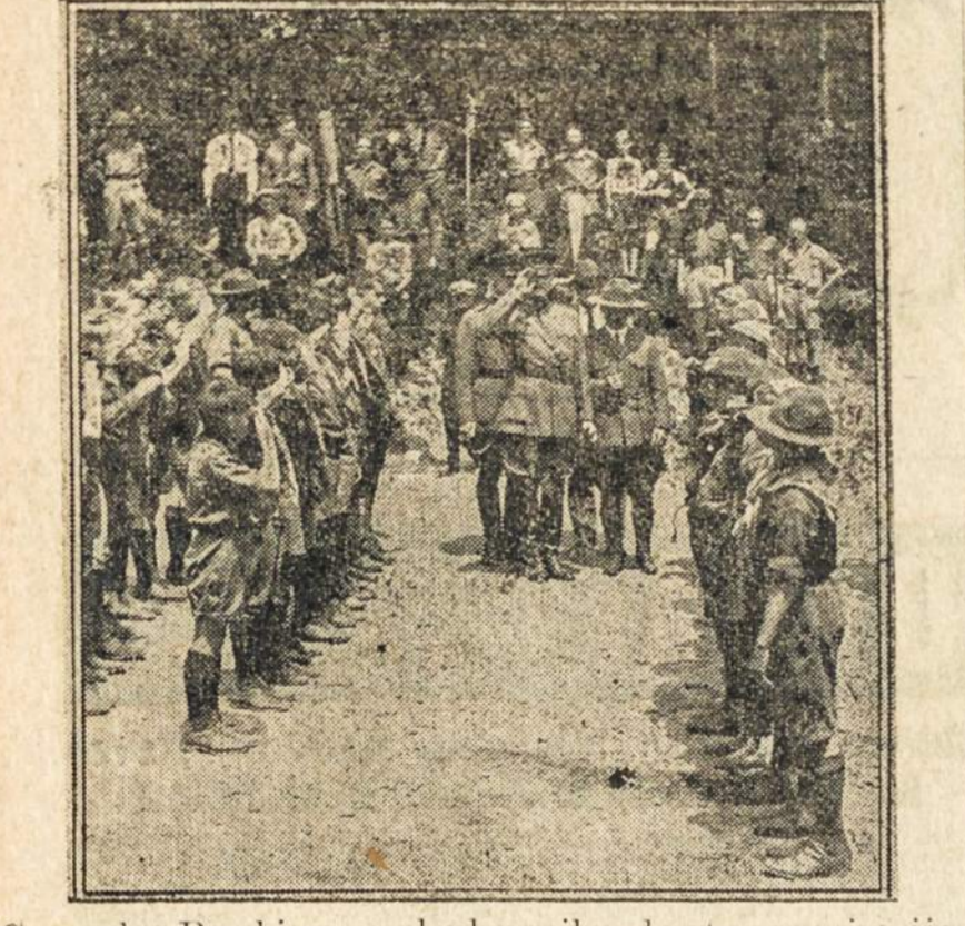
Generolas Pershingas aplanko vaikų skautų organizaciją.