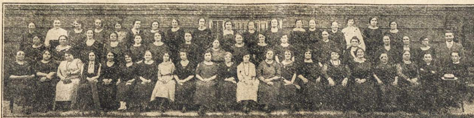
IV šv. Kazimiero Akademijos Rėmėjų Draugijos Seimo Atstovės. Seimas Įvyko Birželio 17 d., Chicago, Ill., šv. Kazimiero Seserų Vienuolyne. Dalyvavo 72 Atstovės.

Prekyba per Klaipėdos uostą pradeda vystytis. Ne tik importas, bet ir eksportas iš Lietuvos pradeda traukti Klaipėdos link. Taip gegužės mėn. 31 d. išplaukė iš Klaipėdos Londonan pirmas laivas "Humus," kurs atidarė mlotatinį susisiekimą su Londonu. Tuo laivu b-vė "Maistas" pirmoji pakrovė 5 vagonus kiaušinių Londono rinkai. Tuo savo žygiu padaryta pirmoji praždia, nežinint rizikos, nes Klaipėdoj nėra tinkamų įtaisymų. Birželio mėn. išplaukė iš Klaipėdos kitas laivas "Kurland," kuriuo ta pašalpa išplaukė 4 vagonus kiaušinių Londonan. B-vė "Maistas" leje ir tiktai birželio 19 dieną palaikydama savąjį uostą ir tosurado. Dvi dieni po suradimo liau pasiryžusi eksportui savo gimnazisto, birželio mėn. 21 d. prekes per Klaipėdą. Tuo tarpu aukštį rytą savo kambary pasikorė siuvėjas Cibulskis. "Liet."