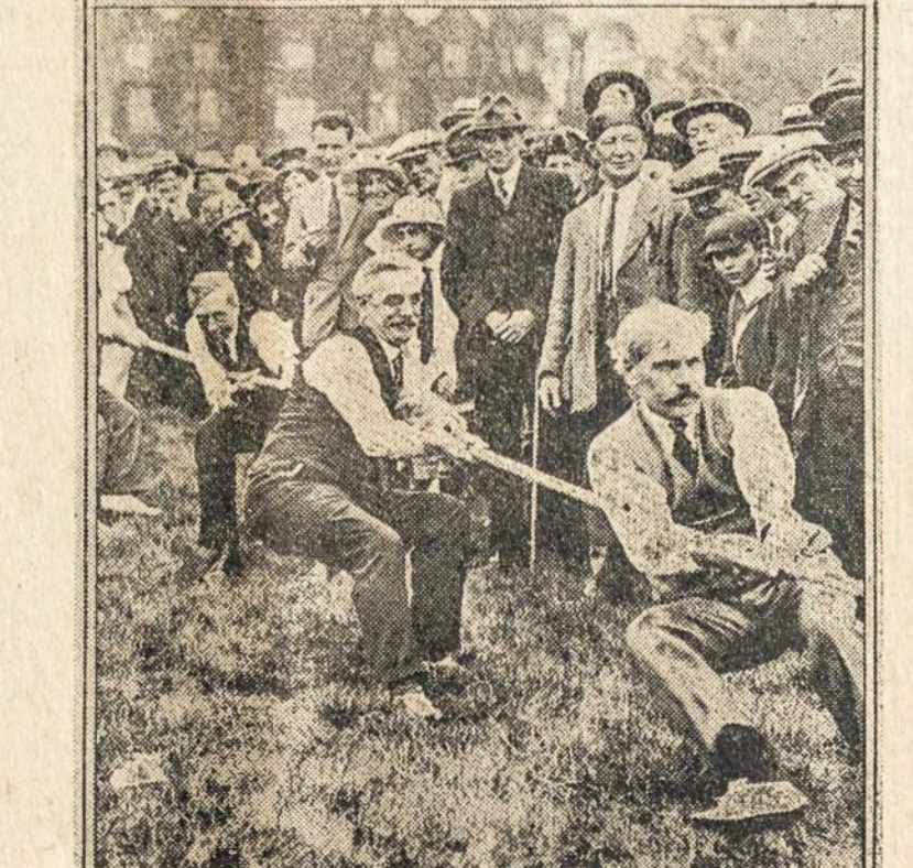
Anglijos darbininkų vadai traukia virvę. Pirmutinis iš jų yra Ramsey McDonald, parlamento narys.