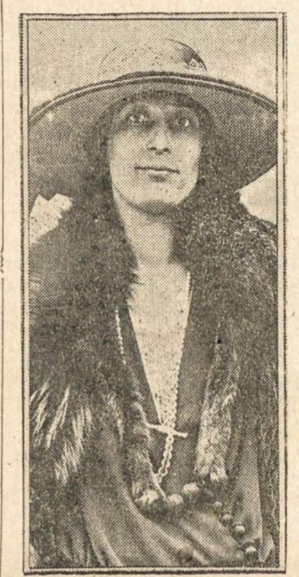
Pirmutinė moteris "Internal Revenue" kolektořė.