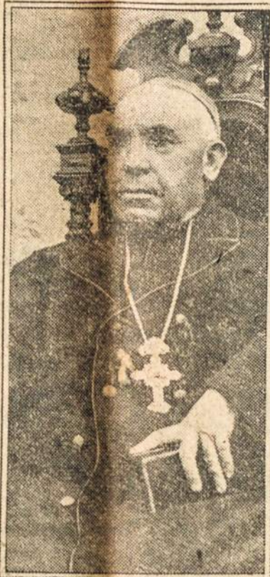
Ispanijos kardinolas Saldevilley Romero, kurį dieviai nužadė.

New Yorkas. — Laive Mary Beatrice kilo mušiai. Užmušta penki kinečiai, du negru ir du baltieji. Mušis įvyko delto, kad pažadėjus kiniečius išmugeliuoti į Ameriką, prižado neišpildė.