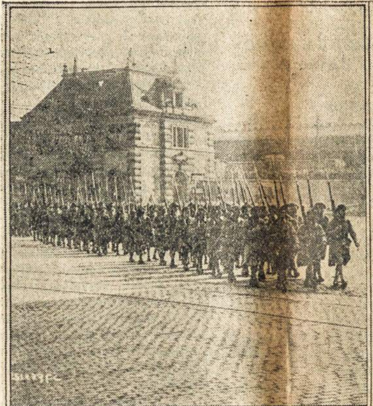
Pilnai apsiginklavusi francūzų kariuomenė įeina į Ruhr apskritį, Vokietijos teritoriją.

Kaunas, Lietuva, sausio 18 d. — Lietuvos premieras, E. Galvanauskas, pareiškė parlamentui, kad Lietuva nepriims Ambasadorių Tarybos nuosprendžio Klaipėdos klausimui, jei jisai bus priešais Klaipėdos krašto gyventojų valią. Laikraščiai sako, kad valdžia atsisakys pripažinti alijantų valdžią Klaipėdoj.