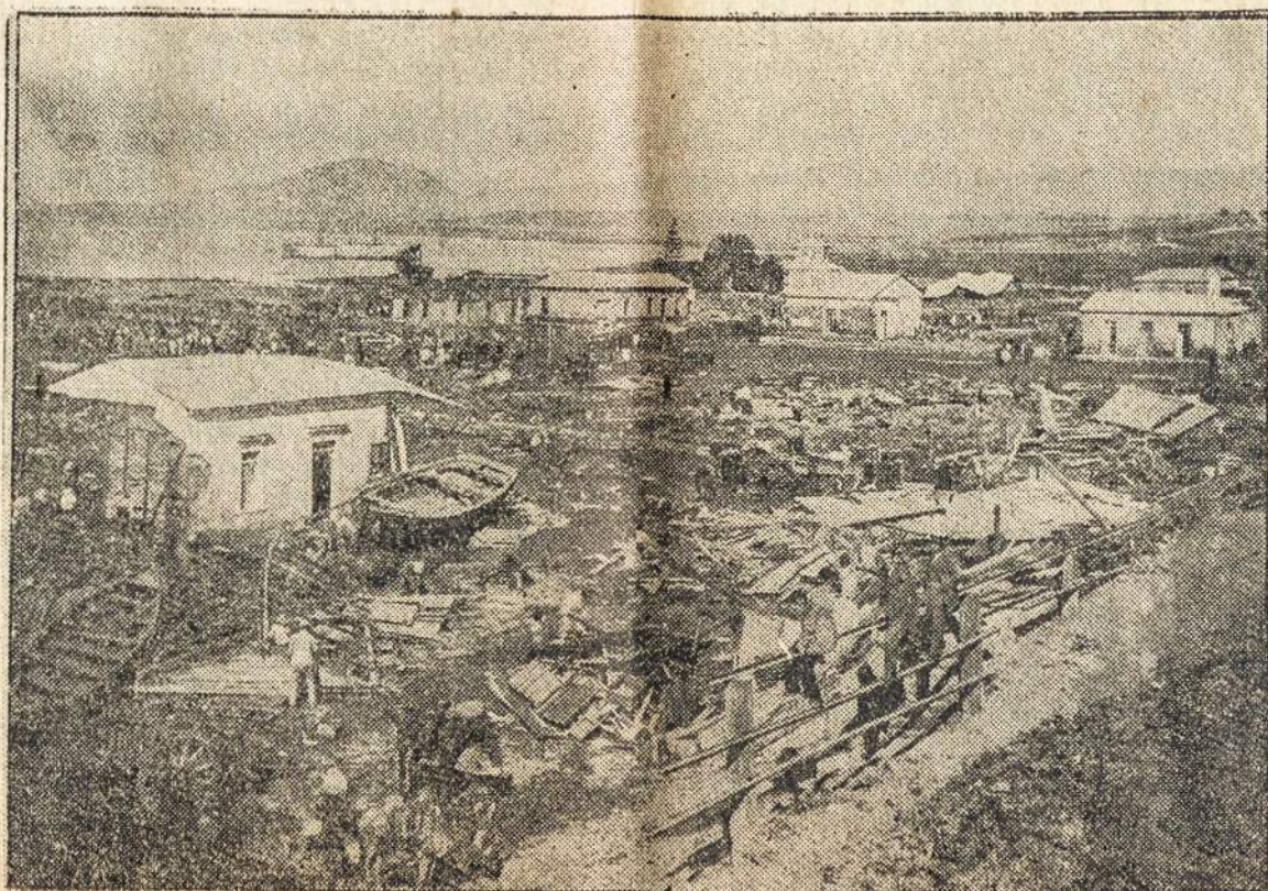
Coquimbo, Ohile, neseniai buvo didelis žemės drebėjimas. Žuvo daug gyvybių, daug nuostolių padaryta. Ši fotografija parodo, kaip gyventojai valo griuvėsius.

tyj lietuviai tad ir vengė iki šiolei susikirtimo su francūzais.