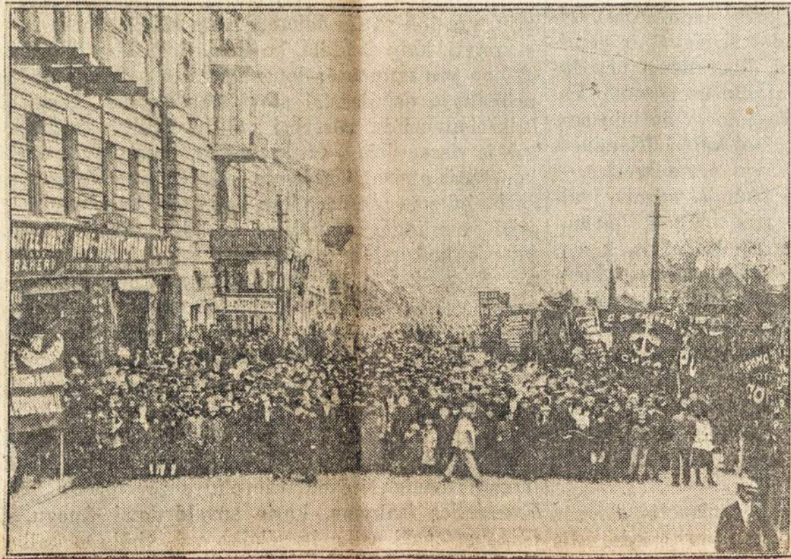
Raudonosios Rusijos sovietų armijos įėjimas Vladivostokan.