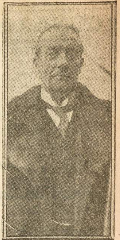
Stanley Baldwin, Anglijos paskolos misijos galva Amerikoje.

Batavia, Ill. — 248 kp. susirinkimas bus 21 d. sausio. Raštiniukas.