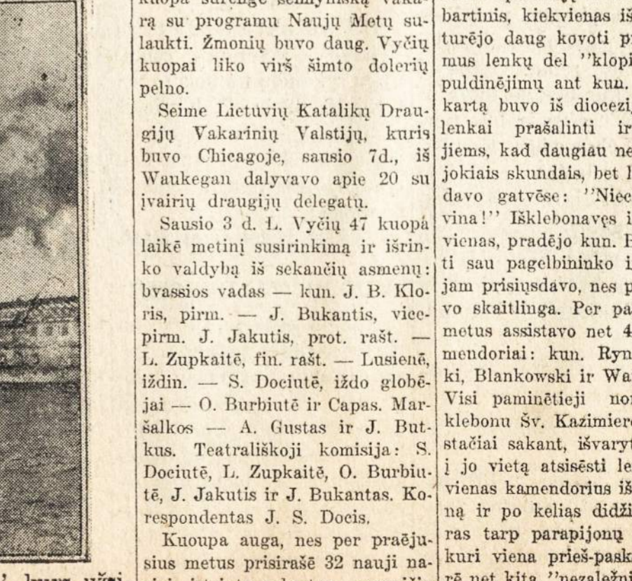
Francuzų liginės laivas "Vinh-Long", kurs uždegtė jurė, netoli Konstantinopolio, nuo kurio išgelbėta keturi šimtai žmonių.