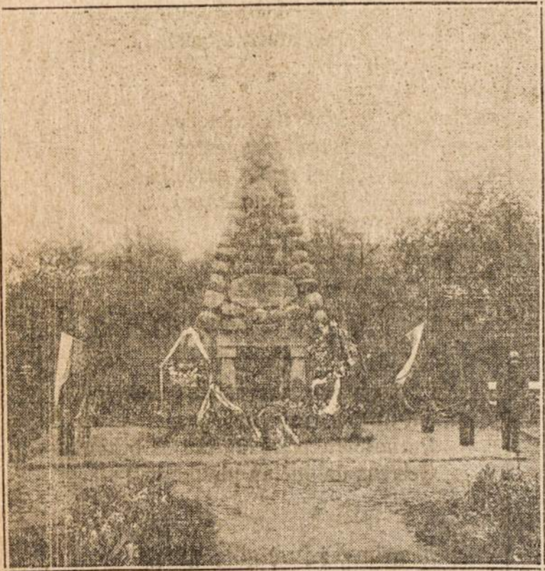
Žuvusiems už Lietuvos nepriklausomybę karžygiams paminklas Kaune, pašventintas spalio 16 d., 1921 m.