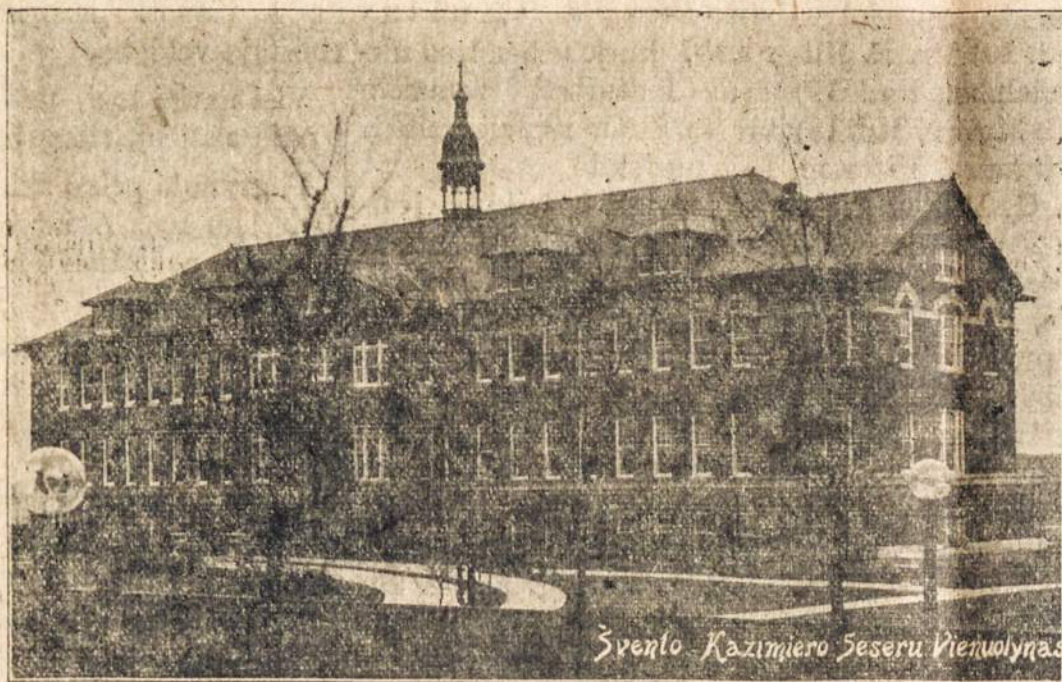
Švento Kazimiero Seserų Mokykla

Mokinama pradinės, vidurinės, komercijos ir augštosios mokyklos kursų mokslai. Taipgi mokinama dailės meno, dainavimo, pianino, smuiko ir kitos muzikos. Šiais metais prasidės virimo ir naminės ruošos kursai. Norintieji platesnio paaiškinimo kreipkitės prie Akademijos Vedėjos, 2601 W. Marquette Road, Chicago, Illinois.