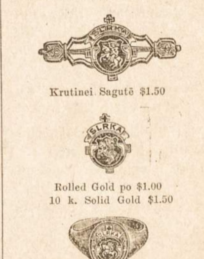
Krutinei Sagutė $1.50