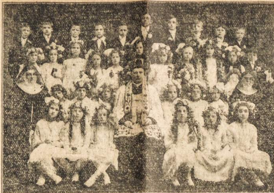
Šv. Panelės Anreiskimo Par. Mokyklos Pirmą Komunią, Brooklyn.