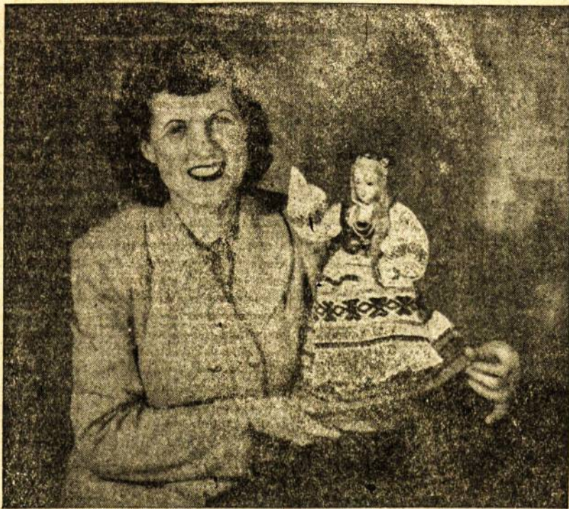
Amerikos lietuvaitė, visnuomenės veikėja, kompozitorė ir dainininkė Adaline C. Ambrose