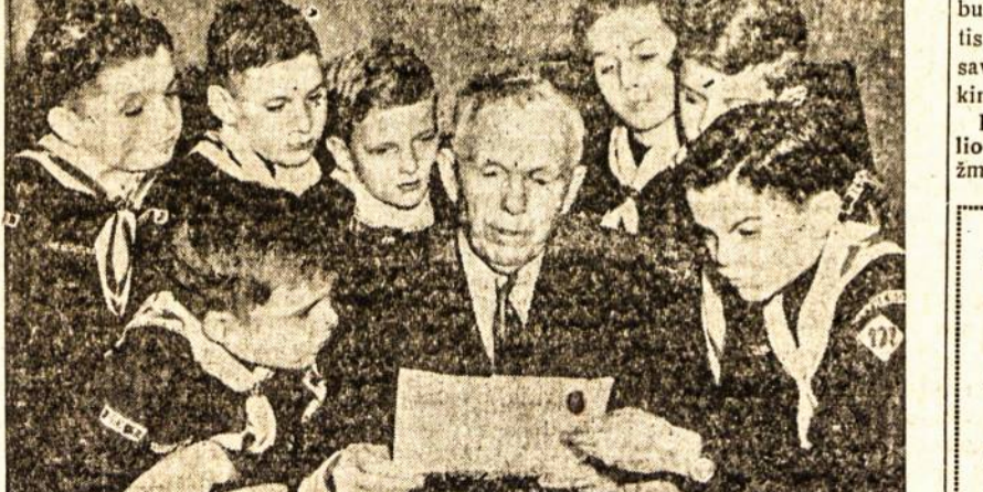
Naujos jaunūmenės organizacijos atstovai su G. C. Marshalliu svarsto programą, pagal kurią numatoma adoptuoti vaikus iš V. Europos

Praha (Dena/Reuteris). Čekoslovakijos užsienio reikalų ministerija perspėjo užsienio spaudos atstovus, kad prieš neteisingus žinių sklaidėjus ryšium su paskutiniaisiais įvykiais Čekoslovakijoje gali būti imamasi atitinkamų žygių.