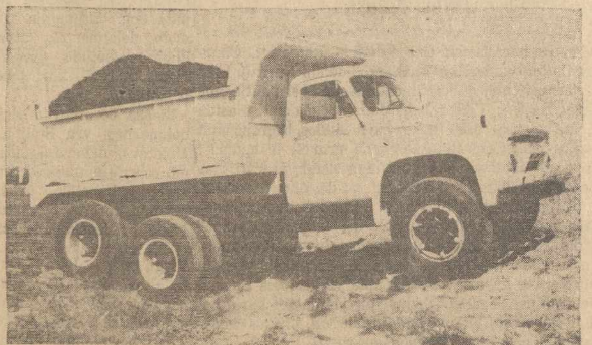
Sis naujas T-800 serijos sunkvežimis tai 1954 Fordo Trigubos Ekonomijos. Gali vežti iki 29943 svary. Kaip traktorius gali vilkti iki 60,000 svary. Turi 170 arkl. jėgų inžiną.

Tuo būdu naujai literatūrai įsigyti reikėjo pinigų. Tam tikslui V. Piešina su kitais platintojais padarė Deltuvos miestelyje rinkliavą. Žmonės gana noriai aukoję pinigų. Vienas ūkininkas neturėjęs pinigų, tai davęs rūkytą kumpį.