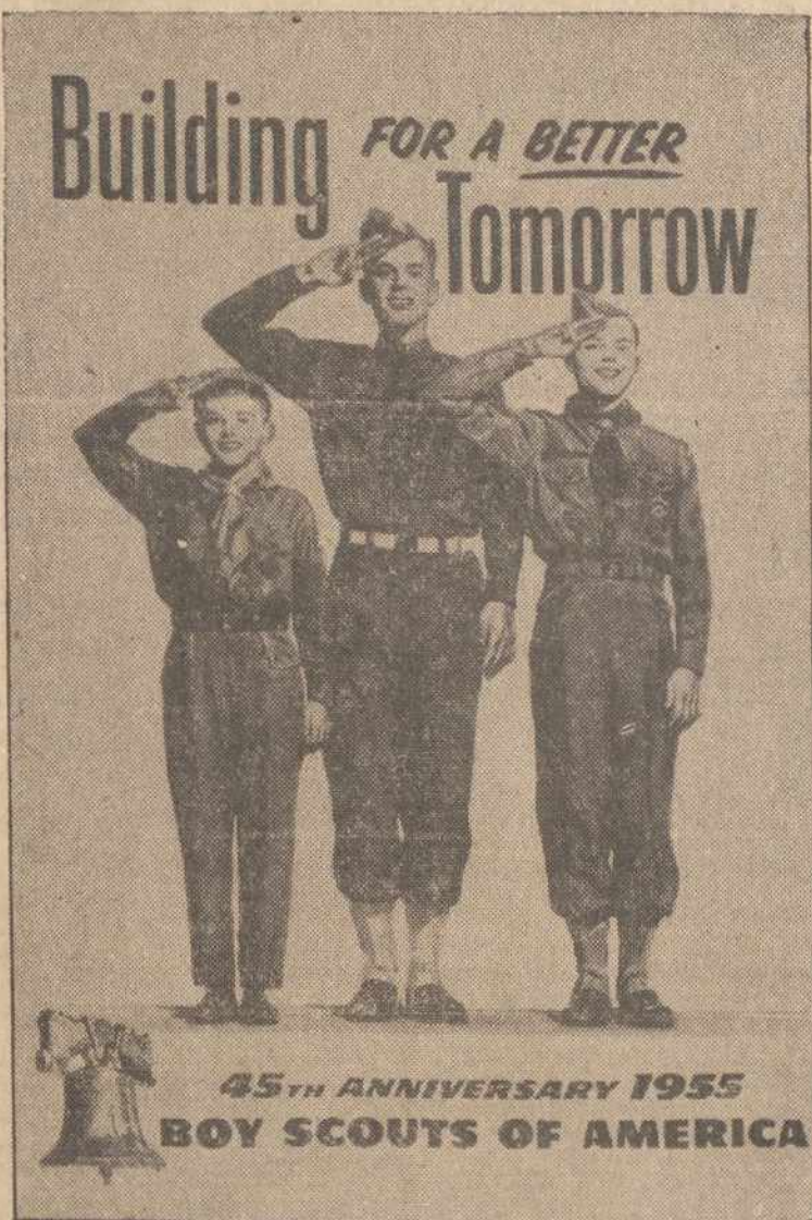
Prasideda Berniukų Skautų Savaitė

Ir britų darbiečiai, ypač kairieji, Beveno klikos, stojo į talką maskolių propagandinėi politikai Vokietijoje. Neabejojame, kad su jais nueis prancūzai ir italai bei kitų vak. Europos kraštų socialistai, jei nevisi, tai žymioji jųjy dalis. Štai kame glūdi tą komunistų politinė audra kuri papurtė Vokietiją ir visą Europą. Šiame momente sunku pasakyti koki bus daviniai naujųjų politinių manevrų Kremliaus valdovų vykdymu Vokietijoj, visgi, mes drįstame manyti ir pasisakyti, kad Malenkovo-Molotovo politinės manevros nebus sekmingos, bet demoralizacijos bus daug pasiekta Vokietijoj ir kituose Europos kraštuose.