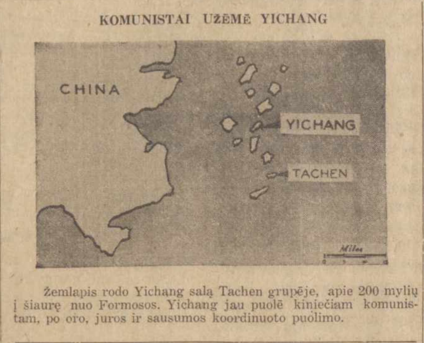
Zemlapis rodo Yichang salą Tachen grupėje, apie 200 mylių į šiaurę nuo Formosos. Yichang jau puolė kiniečiam komunistam, po oro, jūros ir sausumos koordinuoto puolimo.

Nr. 5 WORCESTER, MASS., Vasario (Feb.) 4, 1955 Vol. XLVII