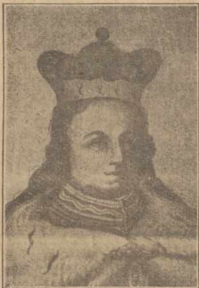
DIDYSIS KUNIGAİKSTIS VYTAUTAS

Vytautui mirus, visa Lietuva buvo nuhudus per ilgą laikotarpį. Lietuvos valstybei labai buvo dideli nuopelnai per Vytauto gyvenimą. Jis rado Lietuvą sudaryta iš daugybės sritinių kunigaikštysčių, o paliko ją vieninga vieno Didžiojo Kunigaikščio valdoma. Per Vytautą Lietuva buvo turtinga, ir Lietuvos žmonės pradėjo šviestis ir vyko mokytis į Europos universitetus. Per Vytautą, Vilnius pasidarė didelis rytų Europos miestas. Irgi dideli plotai žemės, Rusijos priklausė prie Lietuvos. Žodžiu, Vytautas atvedė "Šviesą ir garbę Lietuvai". Jis taktiškai išvedė žmones iš "Pagoniško amžiaus" ir naują progresyvią krikščionišką kultūrą ir gyvenimo tvarką.