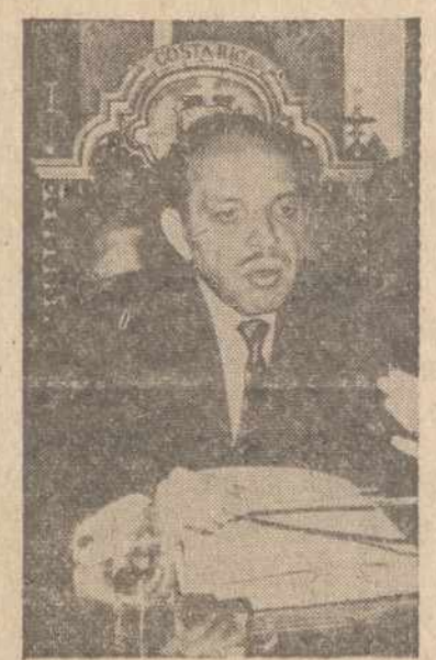
Kosta Rikos Krizis