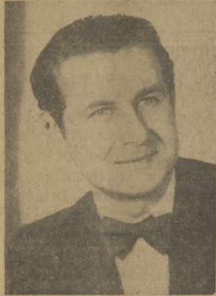
STASYS LIEPAS, Baritonas