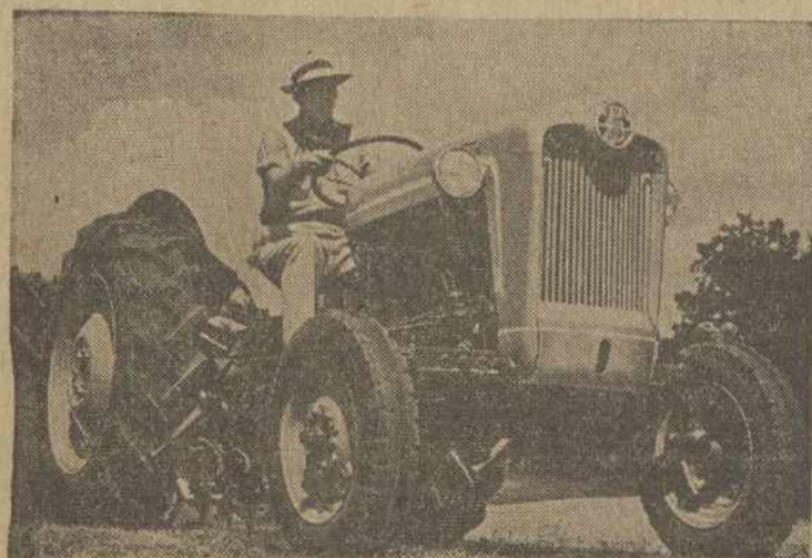
FORD MOTOR kompanija paskelbė penkis naujus ūkio traktorius, 1955 metams.

ningų pagelbininkų turime Sukursime didingus mūsų šiandien irgi daugiausia. sąmoningumo paminklus, ku Tieskime vieni kitiems ran-ris nepaspek aplinkumos jų-ką. O biznieriaus ištiestasis rėse ir svetimi vėjai nesudelnas turi būti ne tuščias.griauas.