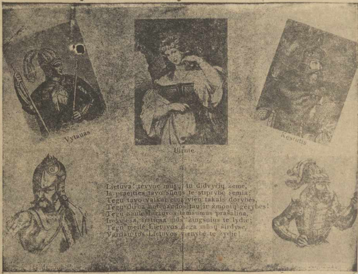
Lietuva, tėvynė mūsų tu didvyrių žeme, Is praeities tavo šlois te stiprybe cemia. Tegu tavo vaikai auga vien tūkais dorybes. Tegu dirba ant naujos tauti ir zmoniu geribes. Tegu saule Lietuvos tamsumus prasalina. Ir sviesa, atneša mūs žingsniu te lydie. Tegu meile Lietuvos žega mūsų širdyse. Vardan to Lietuvos vienibė te zydie!

"AMERIKOS LIETUVI" IR PLATINKIT SKAITYKIT