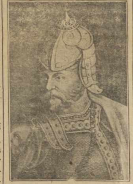
Didis Kunigaikštis Gediminas 1316 - 1341

Lietuviams sekėsi rusų kraštus užimt, nes lietuviai gražiai apsigė su užimtais kraštais ir gražią gyvenimo tvarką ir kultūrą davė rusams. Lietuva tais laikais dar neturėjo tikrą sostinę. Kur didžiausias kunigaikštis apsidodavo, kaip keliaudavo karo žygiams, tai ten tuo tarpu buvo Lietuvos sostinė. Gediminas įkūrė pirmą Lietuvos sostinę, kur buvo Vilnius. (Traidinio laikais — 1275 m. — Lietuvos sostinė buvo centrinė pilis (Kernave).