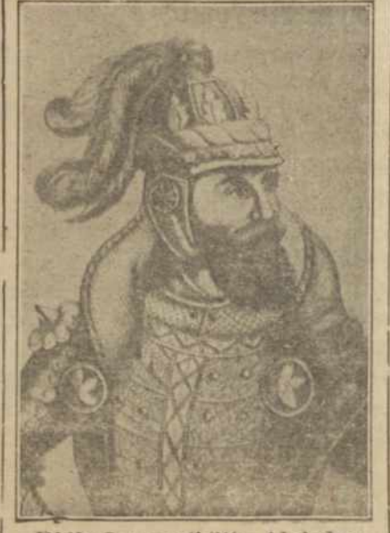
Didis Kunigaikštis Algirdas 1345 - 1377

lebką (Rusijos kraštai); Kęstutis valdė vakarų pasienį Lietuvos, Trakus, Palenkę, Gardiną ir Drastą ir Žemaičių dalis. Kęstutis irgi valdė dideles žemes — Dalis Lenkijos pasienio. Gedimino sūnus Liubartas valdė Lenkijos pasienio dalį, Voluinę su Laeku. Jaunasis Gedimino sūnas Jaunutis, gyveno su tėvu Vilniuje ir dar nebuvo gavęs jokios srities valdyt. Tėvui mirus, jis automatiškai tapo Vilniaus ir gretimųjų sričių valdovas. Bet Jaunutis buvo silpnas ir mažai darytes apie karo žygius, ir kadangi karo pavojus gresė nuo Ordino, tai Kęstutis su savo broliu Algirdu prašalino Jaunutį.