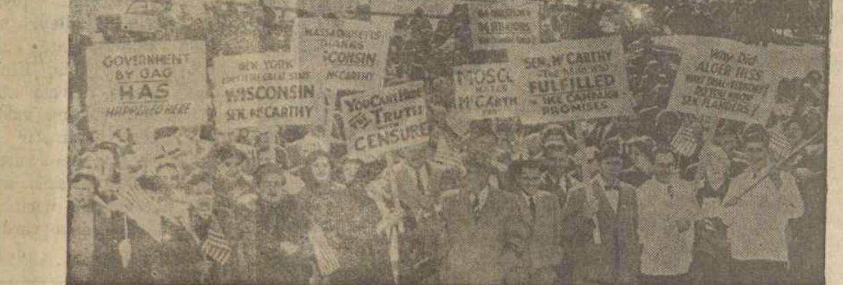
MCCARTHY SIMPATIZATORIAI, WASHINGTON, D. C. WASHINGTON, D. C. — Šimtai McCarthy simpatizatorių atvykę į Washingtoną aplankė savo senatorius grupėse ir išreiškė savo nusistatymus.

Vienu akimirksniu Petro sieloj blykstelėjo doras jausmas, bet jis jį greitai nuolpino. Jis gal-