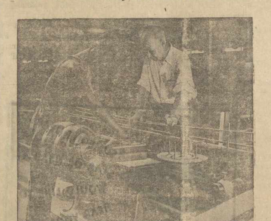
Jungtinių Tautų Korėjos Atstatymo agentūra (UNKRA) parūpino technikos specialistus mokyt vėliausius technikos būdus Korėjos spaustuvninkams.

SKAITYKITE ir PLATINKITE "AMERIKOS LIETUVI"