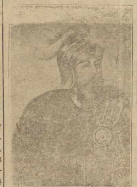
Didis Kunigaikštis Kęstutis 1377-1392

Atsuygindami Lietuvos kunigaikščiai užpuolė Kryžiuočius 31 kartų į Lietuvos vakary pusę, o į Livonijos pusę 11 žygių padarė. Nemuno pakrontėje ėjo nuolatinė kova dėl pilių, Algirdo laikais. Dabar jau Kryžiuočiai skaitėsi su Lietuva, kaip su valstybe ir karas jau tebebuvo vien skerdynės. Jau buvo laikomasi tam tikros karo etikos, kaip kad įvyko tarp šaių vakarų Europoje. Visa kovos našta su