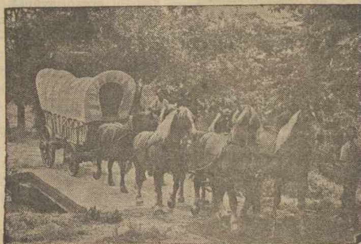
Taip kolonistai keliaudavo į ieškoti naujų dirvų, ir laimės iš rytų į vakarus.