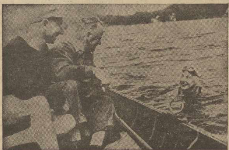
FLORENCE CHADWICK ruošiasi perplaukt vandeniu tarp Port Angeles ir Victoria, B. C.

Komunistas visur toks pat, visuose pasaulio kampuose, nežiūrint odos, tautos, kalbos ar krašto. Rusas generolas Konevas Austrijoje buvo pavainikas broliukas korėjiečiui generolui Nam II Panmunjone, tartum vienos motinos išauklėti tiems patiems komunizmo tikslams. Jų pareiga buvo sukurti, meluoti, žmogžudžiai ir knistis po visais laisvojo pasaulio pagrindais, ir tais būdais stiprinti komunistinį pasaulį. — (Iš amerikono