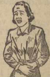
Lydia Pinkham's has a quieting effect on the uterine contractions (see chart) which may often cause menstrual pain!

ern in action. It exerts a remarkably calming effect on the uterus—without the use of pain-deadening drugs! The effectiveness of Lydia Pinkham's needs no proof to the millions of women and girls whom it has benefited. But how about you? Do you know what it may do for you? Take Lydia Pinkham's! See if you don't get the same relief from cramps and weakness... feel better both before and during your period! Get either Lydia Pinkham's Compound, or new, improved Tablets, with added iron! Lydia Pinkham's is wonderful for "hot flashes" and other functional distress of the "change of life," too!