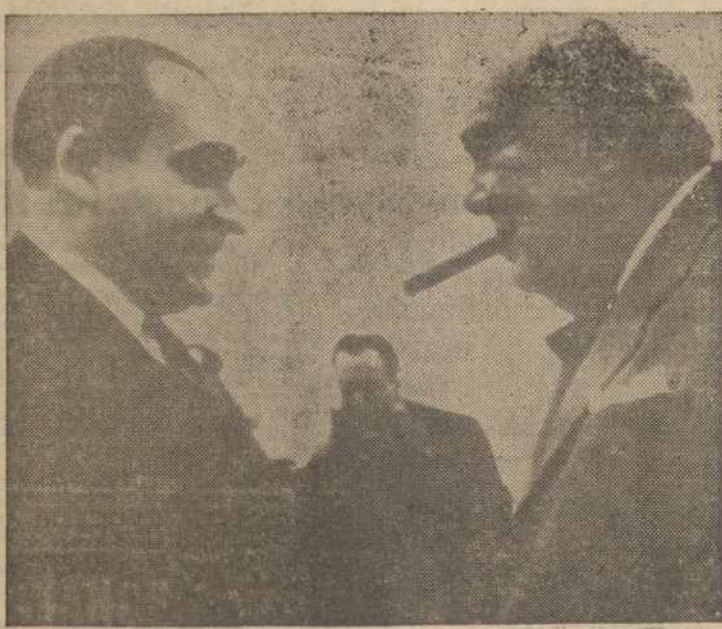
WESTERHAM, England. — Premieras Sir Winston Churchill sutinka Prancūzijos premierą Pierre Mendes-France, kurs atvyko pasitart del Europos Gynybos sutarties revizijos.