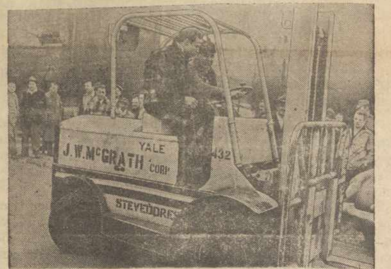
MARLON BRAND, kairėje, Columbia paveikslų žvaigždė mokina kaip operuoti Yale išdirbystės pakėlimo mašiną naudojamą uostose.