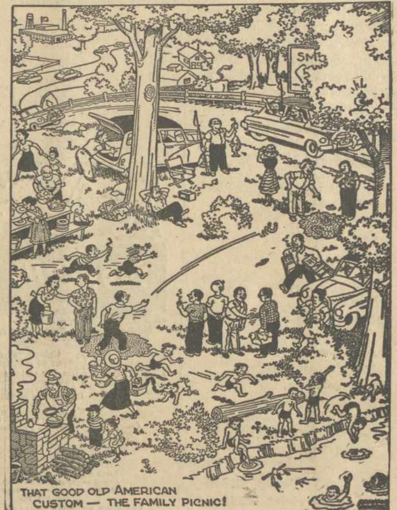
THAT GOOD OLD AMERICAN CUSTOM — THE FAMILY PICNIC!

"Amerikos Lietuvio" metinis piknikas, 50 m. Lietuviškos Spaudos Atgavimo su kaktuvėse įvyks sekmadienį, rugpjūčio 29-tą, Jurgio Babrausko pavilijone, Manville gatvės, Leicester, Mass.