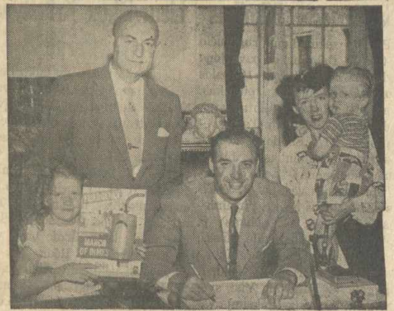
LEIT GUB. WHITTIER PRIIMA DEL POLIO AUKŲ RINKIMO GRUPE

Vieną ankstyvą rytą, atsiėkėliau. Rytas gražus, paukščiukai čiulba ant medžių šakelių. O mano šunukas vardu "Smokis" guli kieme. Dar anksti eiti į darbą, užsidegiau cigarete. Štai atbėgo kaimyno šuo, laksto po kiemą, turbūt alkanas, nori est. Mano Smokis atsikėlė, priėjo prie kaimyno šunies, apsiuostė abu. Mano Smokis nuvedė savo draugą už garadžiaus, iškasė iš žemės didelį kaulą. Kaimyno šuo pasigavo ir perbėgo namon su kahu. Sekantį rytą, kaimyno šuo vėl atėjo, bet dabar nuėjo tiesiog už garadžiaus ir kasa žemę. Mano Smokis galvą padėjęs ant žemės žiūri ir urškia. Kaimyno šuo jau nešasi kaulą, o mano Smokis atsistojo