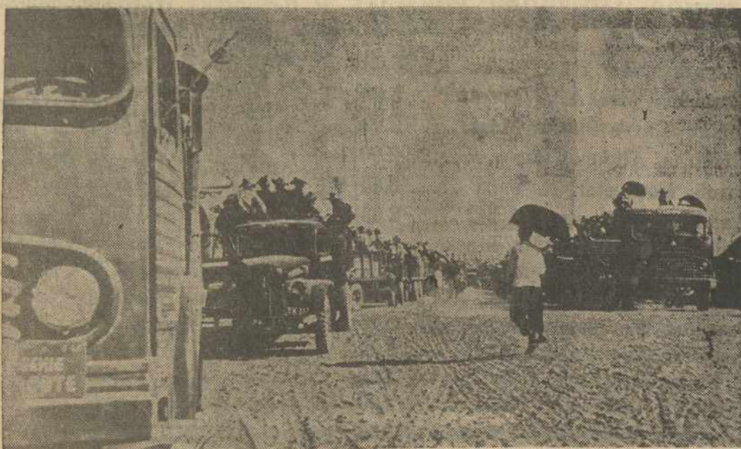
HANOI INDO-KINJA. — Pabėgėliai vyksta iš Raudonos Ūpės Deltos srities, kurią apleido Prancūzų Unijos kariuomenė.