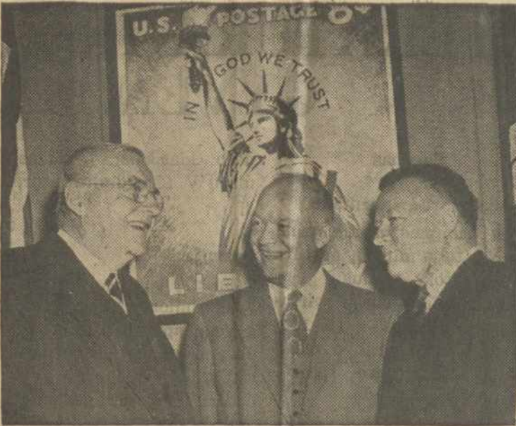
PREZIDENTAS Eisenhower, valstybės sekretorius John Foster Dulles, pašto viršininkas Arthur E. Summerfield, stovi prie naujo pašto ženklų padidinto paveikslėlio.

Aš sutikau su jo nuomone, Mes esame išvarkarėse karalienės Mikaldos pranašaujamos eros ant šio žemės kamolio skrendančio erdve iš dienos į dieną, kuriame retas žmogus išliks gyvas jei sulauksime atominio karo. Štai kodėl dabartinė situacija kelia nerymą ir drumsčia mūsų krašto žmonių gyvenimą vasariniame žemės rojuje, ypač tų, kurie turi turtus ir gyvenime malonumus.