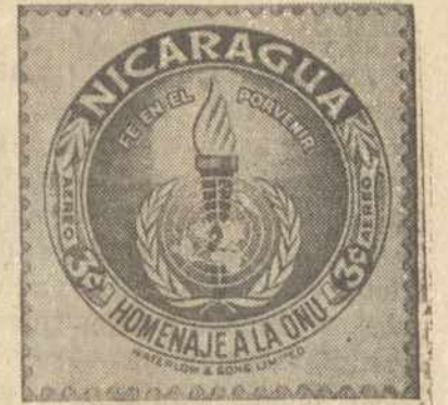
Above is one of 12 stamps which Nicaragua has issued to honor the United Nations. It is a three-centavo, magenta color, air mail stamp. Others—both ordinary and air mail—range in face value from three centavos to five córdobas. Many other countries have issued stamps to honor the U.N., including Liberia, Indonesia, France, Ecuador and Honduras. The United States issued one with a United Nations theme in 1945 during the San Francisco Conference.

staiga atidarė duris į kiemą ir pamatė prie lango stovintį Micutos berną.