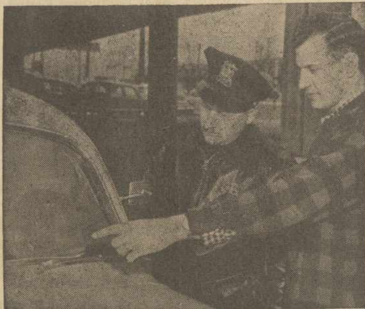
Toki mašinų langai apsitraukia, kuritose randama netinkama medžiaga naudojama stiklus išdirbant.