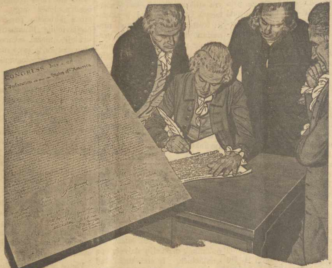
Amerikos Nepriklausomybės deklaracija pasirašyta liepos 4, 1776 ir dabar tas istoriškas įvykis džiaugsmingai finėjamas, ne tikai Jungtinėse Valstybėse bet ir bisame pasauly, kur tik randasi amerikony.

Išvada. Nepuolimo paktų su Sovietine Rusija ir Kinija sudarymas yra tik priešiško stiprinimas gal tiniai juo pergalei t.y. likusio Vakarų pasaulio užvaldymui, neišskiriant nei Anglijos nei Amerikos.