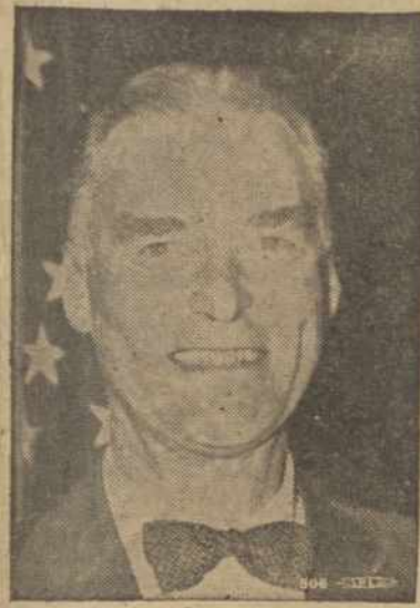
GUBERNATORIUS CHRISTIAN HERTER

KELRODIS: Iš Cambridge gatvės, pasukt į Freemont St. paskui Webster iki Boyce, iš ten po kaire Rockaway drive iki Parko. Autobusas numeris 21, Hadwen Park. Bus iškabos nurodančios vietą.