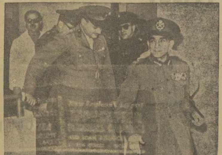
Egipto Prezidentas Naguib, dešinėje, įstojo ligoninėje. Jį patyli militariškos ligininės vedėjai.

Čia tik perbėgau pačias pagrindines sritis, kurios turėtų įeiti į Lietuvių Prekybos Rūmų veikimo uždavinius. Tuos uždavinius nesunku bus atlikti, jei prie to einama sistematingai ir organizuotai. Amerikos lietuvių biznieriai yra didelė potencialė jėga, jei tik jie veiks organizuotai.