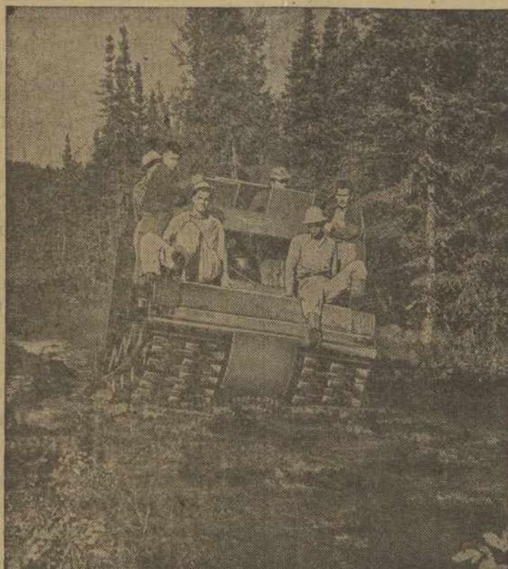
Naujas traktorius pagelbsti žmonėms, kurie ieško aliejaus šaltinių Kanadoje.