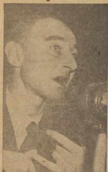
Dr. J. R. Openheimer buvo suspenduotas Atomiškos Energijos Komisijos.

7. Po važiavimo patikrinkimo patikrinkite ranka automobilio šaldytuvą. Jeigu čia būna kelios vietos šaltos, tai šaldytuvą gali būti užkimštas purvų ir jūs netolimoje ateityje turėsite sunkų.