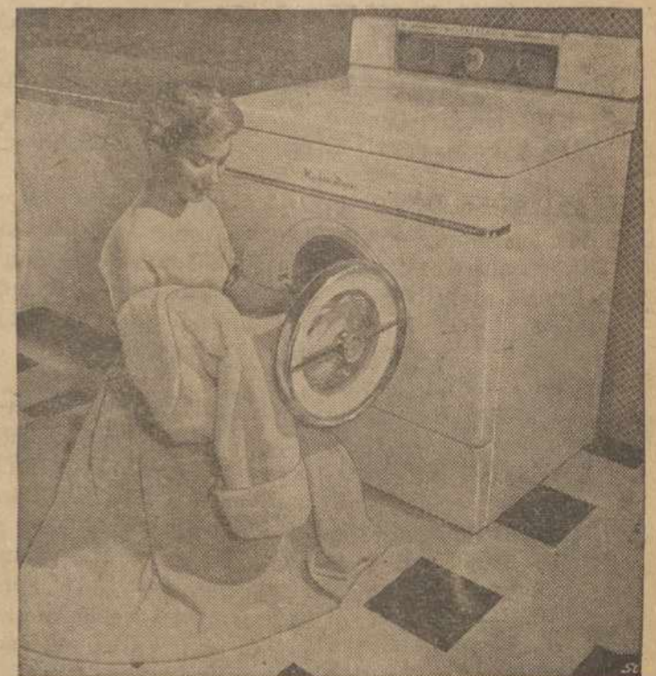
verkus galima išvalyt skalbimo mašinoje