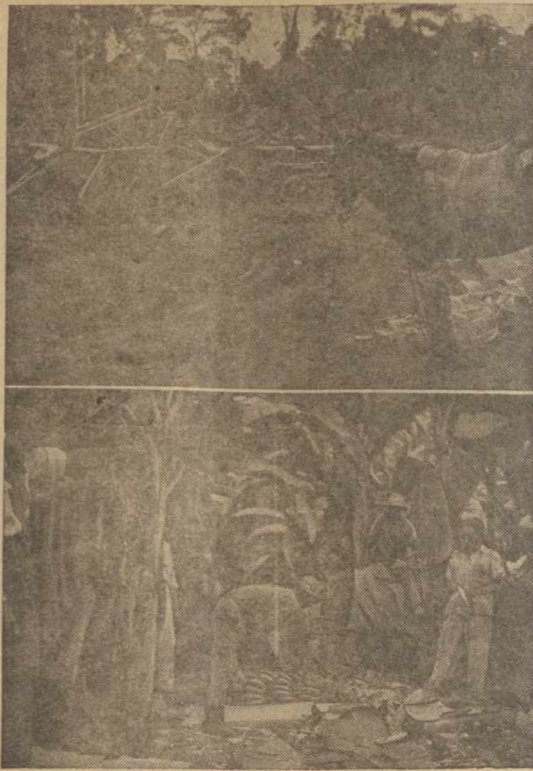
Jungtinų Tautų Veikimas Praplėstas Viso Pasaulio Kraštuose

Lydia Pinkham's has a quieting effect on the uterine contractions (see chart) which may often cause menstrual pain!