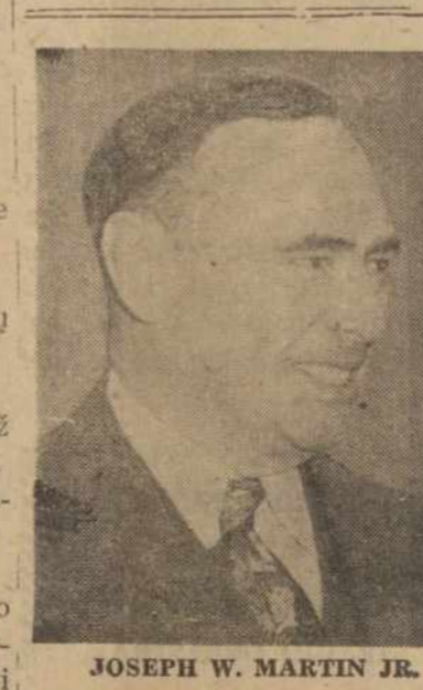
JOSEPH W. MARTIN JR.

Šeimos kurios norėtų patirti daugiau apie nelaimingų vaikų — našlaičių adoptavimo sąlygas turėtų kreiptis į artimiausią Vaikų Globos agentūrą jų kai- minystėje.