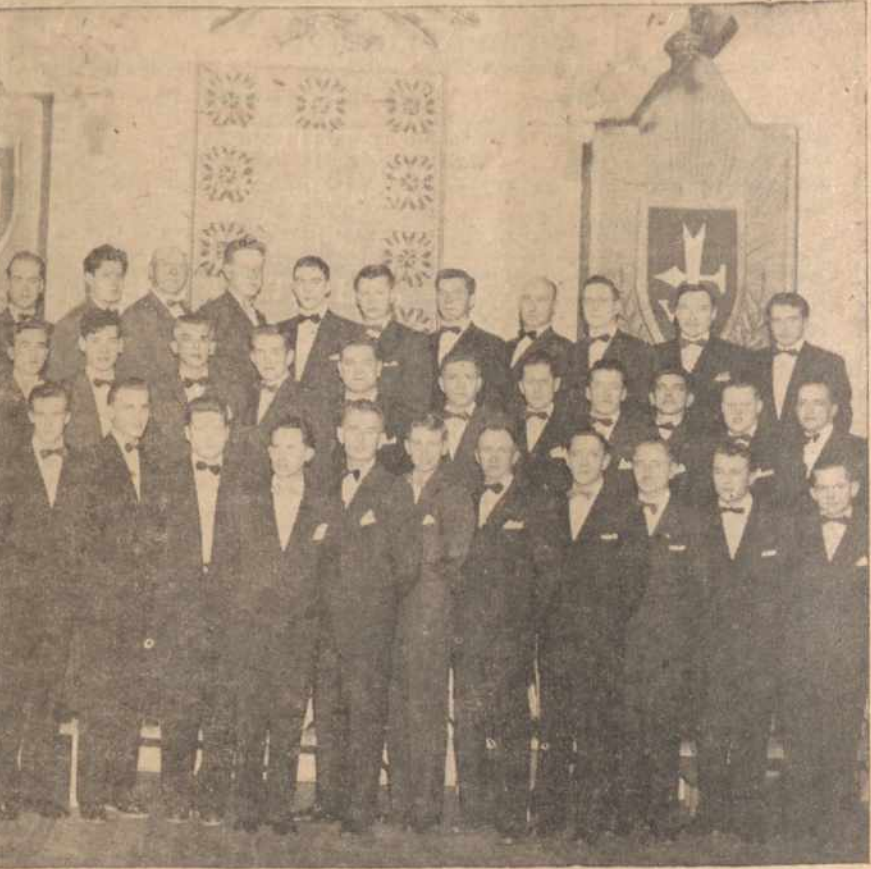
BOSTONO LIETUVIŲ VYRŲ CHORO