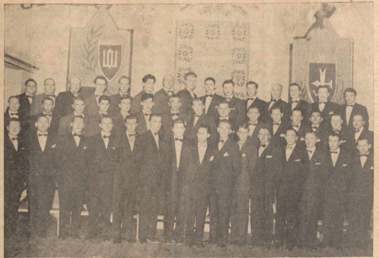
BOSTONO LIETUVIŲ VYRŲ CHORO

Pavykęs susirinkimas, padidino Sąjungą, keliolika narių. Koresp.