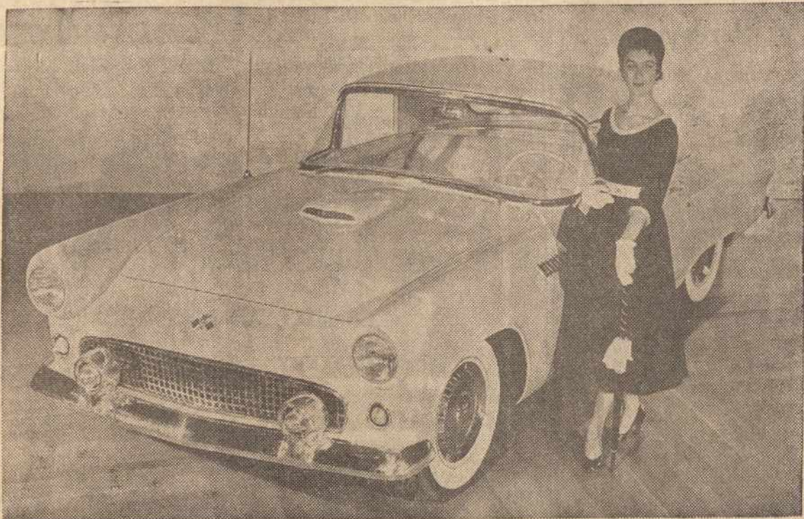
VĒLIAUSIO 1954 M. MODELIO AUTOMOBILIS