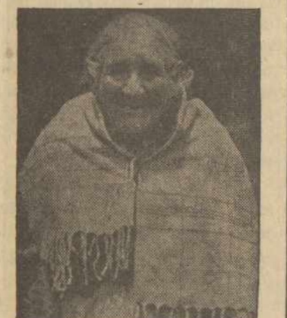
Apie 120 metų sulaukusi ponja Chambi, gyvena Andes kalnuose, Peru, P. Amerikoje, turi virš 20 vaikų, dvynukes, virš 70 m.