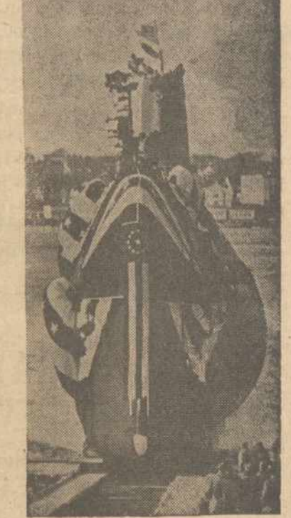
GROTON, Conn. — Pasaulio pirmas atomo varomas povandeninis laivas Nautilus, pakrikštytas Prezidento žmonos Mamie Eisenhower, pradėjo savo pirmą kelionę.