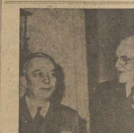
BERLYNAS, Vokietija. — Prancūzijos Užsienio Ministeris Georges Bidault, (kairėje), J. V. Užsienio sekretorius John Foster Dulles ir Britanijos Užsienio reikalų ministeris Anthony Eden susirinko Berlyne į konferenciją.

Sovietinės Vokietijos įstaiigos per kelius pastaruosius metus yra atsiuntę į Vakarų Vokietiją ir Vakarų Berlyną apie 5,000 savų agentų, tačiau vakariečių įstaiigoms visų jų pavardės yra žinomos.