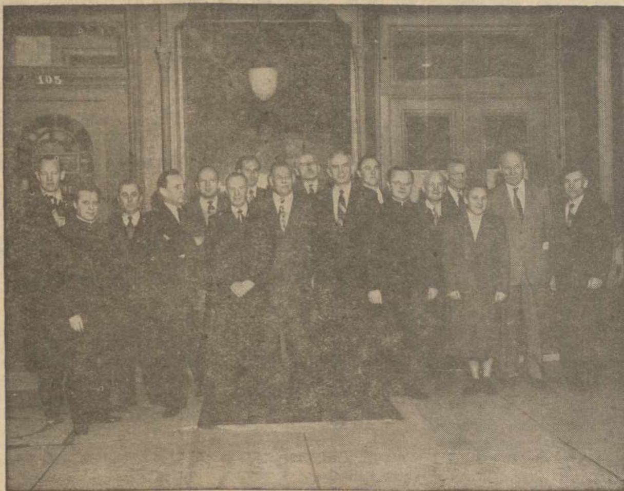
Didžiojo New Yorke 1953 metų BALFo Vajaus Komitetas ir Visuomenės Atstovai Vajaus Užbaigtuviniame susirinkime: