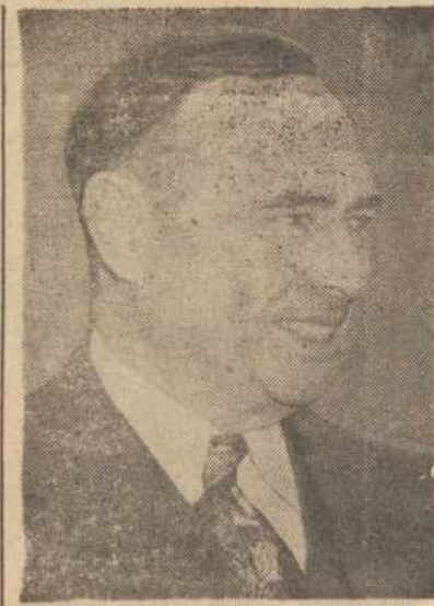
JOSEPH W. MARTIN JR.

The United States, for its part, maintains the diplomatic recognition which it extended in