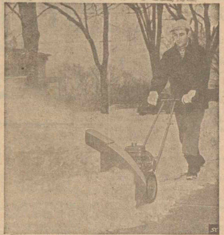
Elektros Varoma Mašina Sniegą Nukasti

368 MAIN ST. Opp. Foster Street Worcester 8, Mass.