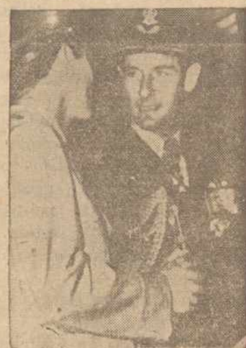
Vienas iš Anglijos Princesės Draugų