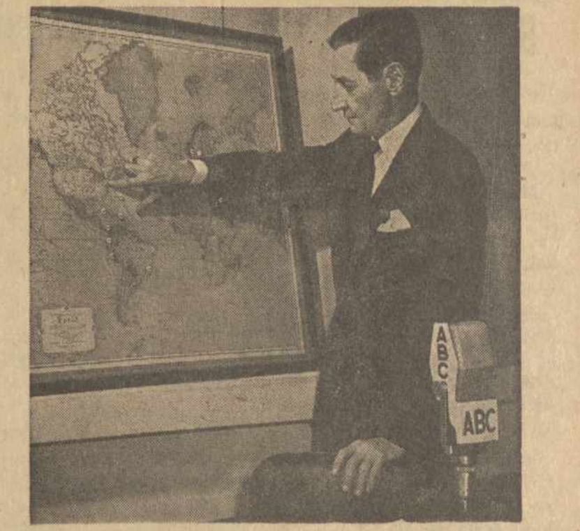
HENRY J. TAYLOR, žymus radio komentatorius tik ką sugrįžo po kelionės aplink pasaulį.