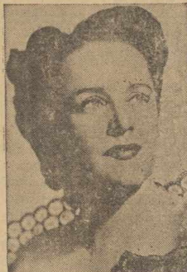
Eleanor Steber Music Festival Artistai