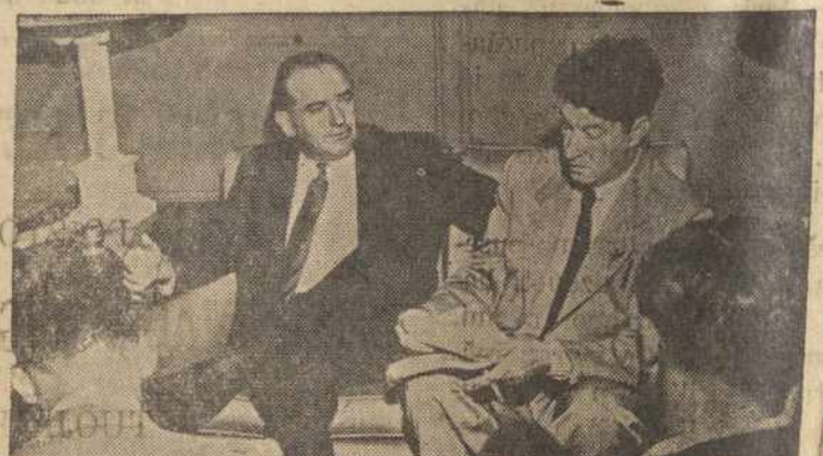
LOS ANGELES, Calif. — Sen. J. McCarthy (kairėje) klabinasi sus paudos atstovais prieš išklašinėjimą liudininkų tyje neįslaptų dokumentų dingimą iš J. V. Vyriausybės Spausu-