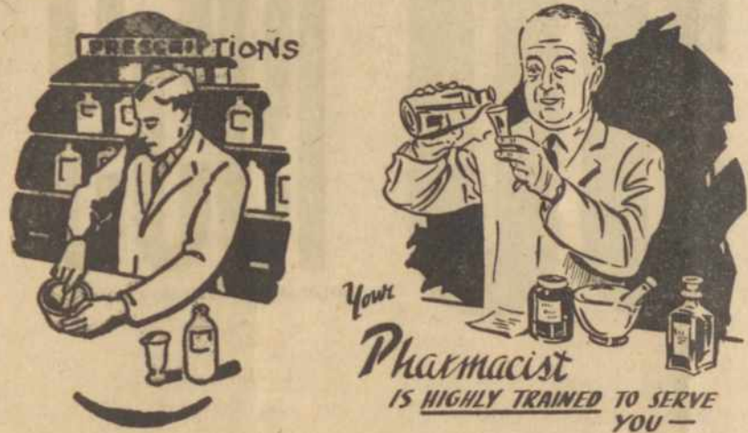
LIETUVIAI REMKITE LIETUVIŠKĄ VAISTINĘ