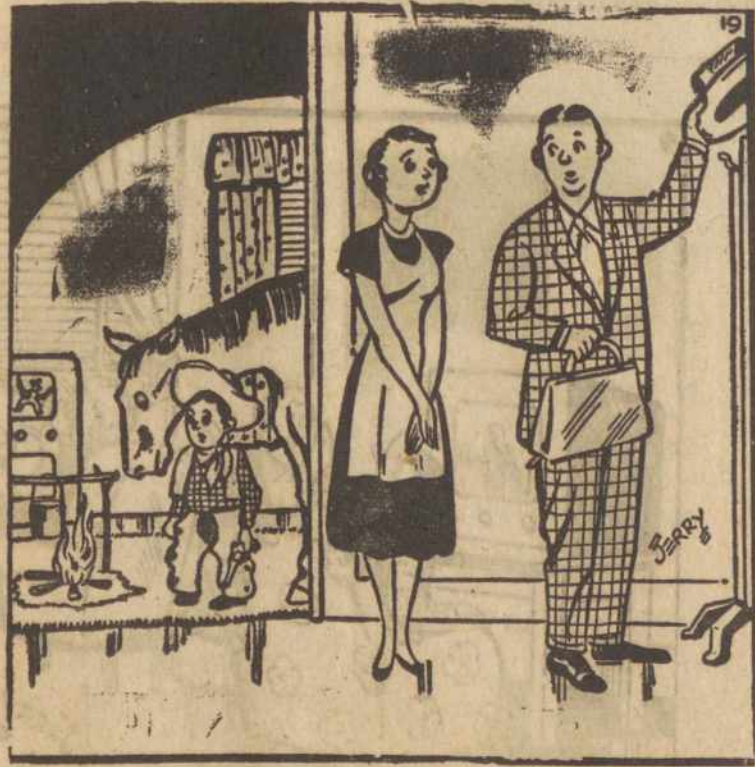
"Dabar jis prašo muilo!"