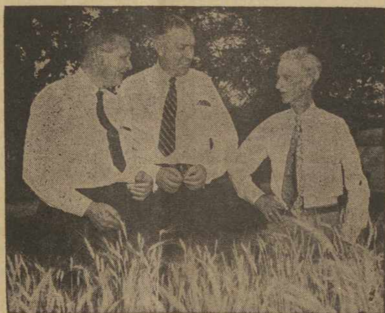
Neseniai Overland Park, Kansas valstijoje, įvyko Kansas Kviečių Pagerinimo Sujungos išvažiavimas. Viršų trys ūkio specialistai peržiūro pagerintus kviečius.