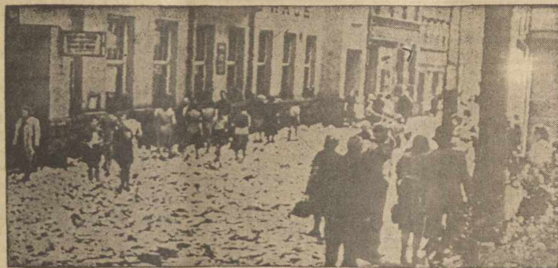
Vaiždas iš Rytų Vokietijos miesto Jena, ten kur įvyko sukilimai, Gatvėse išmėtyta plūkai, su protestais prieš komunistus.