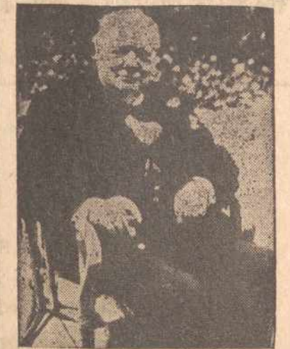
LONDON. — Britų premieras Winston Churchill sveikata susilpnėjo, dėlto Bermudos konferencija atidėta.

Europos valstybių nepriklausomybę. Dabar Eisenhoweris klaidų, apmokamų žmonių gyvybėmis ir mažų tautų genocidu, žada nepakartoti ir Bermudoje laikytis griežtai. Todėl pabaltiečių spaudoj daroma išvadų, jog Bermudoj Pabaltijo padėtis neturėtų pablogėti. Pabaltiečiai turi daug simpatijų kongrese. Pasitarimų su Sovietais metu kongresas pasiryžęs budriai sekti kiekvieną prezidento žygį.