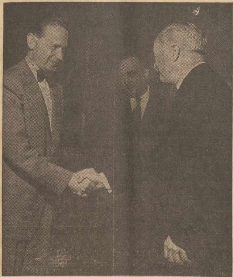
Dag Hammarskjöld, J. T. Generalis Sekretorius sveikinasi su Breck Chisholm, buvusiu Pasaulinės Sveikatos organizacijos generaliu direktoriu, Genevoje, Šveicarijoje, laike šešto Pasaulinės sveikatos konferencijos.

Kitas respublikonas, senatorius Hickenlopper iš Iowa, vadovaujas JAV užsienio informacijos tyrinėjimui, sako: "Mes reikalaujame, kad viešas JAV agentūros būtų apvalytos nuo komunistų ir komunizmo propaguojančios literatūros."