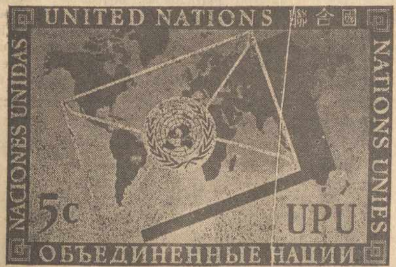
Jungtinės Tautos pagerbė Pasaulinę Pašto Uniją (Universal Postal Union) su šiąja pašto markute. Šioji markutė buvo išleista birželio 12-tą, po tris ir po penkis centus.

Didžiausia prekyba JAV vyksta Ohio upės baseine, kuriuo praplukdomas didžiausias tonažas upinio laivyno.