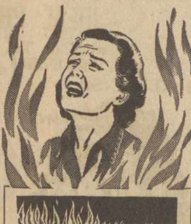
How Lydia Pinkham's works It acts through a woman's sympathetic nervous system to give relief from the "hot flashes" and other functionally-caused distresses of "change of life."

Try Lydia Pinkham's on the basis of medical evidence! See if you, too, don't gain blessed relief from those terrible "hot