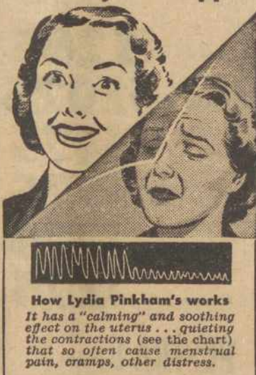
How Lydia Pinkham's works It has a "calming" and soothing effect on the uterus . . . quieting the contractions (see the chart) that so often cause menstrual pain, cramps, other distress.

And it should encourage you (if you're not taking Lydia Pinkham's) to see if your experience doesn't match theirs. . . to see if you, too, don't avoid