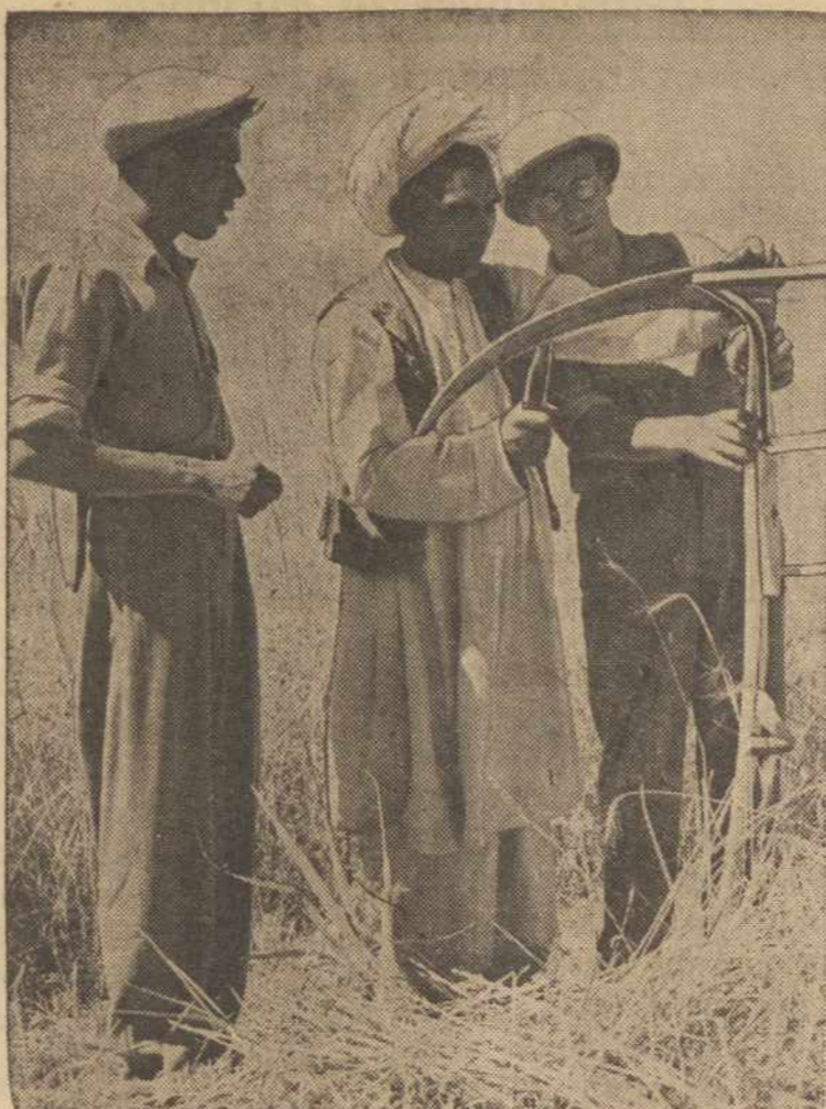
Ūkininkas Afghanistane (kairėje) mokinasi kaip paaštrinti dalgį. Jungtinės Tautos pagal techniška programą pasiuntė ekspertus — šveicarus sumodernizuoti ten ūkius.

Laikas rimtai susidomėti ir padidinti lietuvių kalbos ir rašybos kursų mokyklų organizavimą Amerikoje mūsų jaunimui. Tai geriausias būdas išgelbėti mūsų tautą nuo pražūtis.