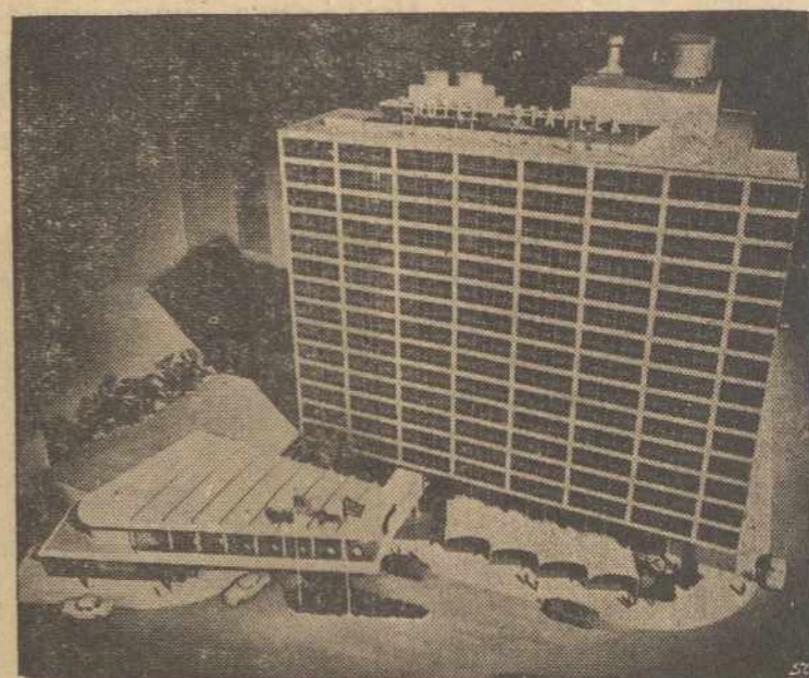
Hartford, Conn. — Naujas Statler viešbutis statomas, panašus į Jungtinių Tautų pastatą, New Yorke. Viešbutis yra ultra moderniškos, sienos iš stiklo ir aluminumo.