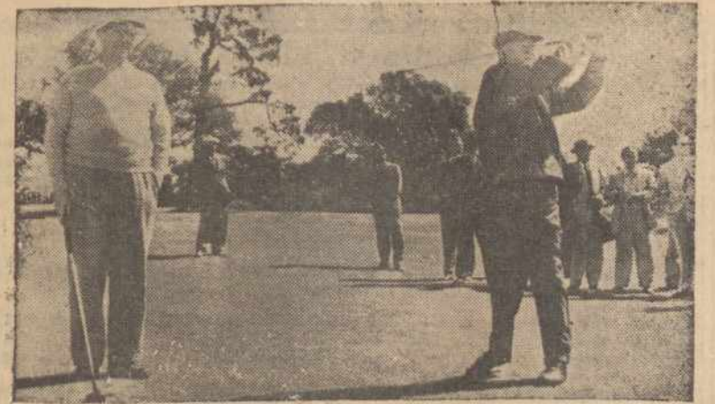
Prez. Eisenhower lošia golfą, senat. Robert Taft tēmija

Apšvelgdamas atliktus darbus, Informacijos Tarnybos Valdytojas nurodė, kad nuo š. m. sausio mėn. pradėta leisti "ELTA — Pressedienst" ("ELTOS biuletinis vokiečių k.). Šio biuletinio reikalingumas jau seniai buvo jaučiamas. Sustabdžius Vokietijos Lietuvių Bendruomenės Informacijos Biuletinio vokiečių kalba leidimą, jo aktualumas dar padidėjo. Šiuo metu ELTOS biuletinio vokiečių k. leidžiama yra po 200 egz. Jį siuntinėjama į 12 valstybių. Jį gauna pirmoje eilėje spaudos biurai, radiofonai laikraščių redakcijos, parlamentarai, mokslinės institucijos bei atskiri tur klausimais besidomintieji asmenys.