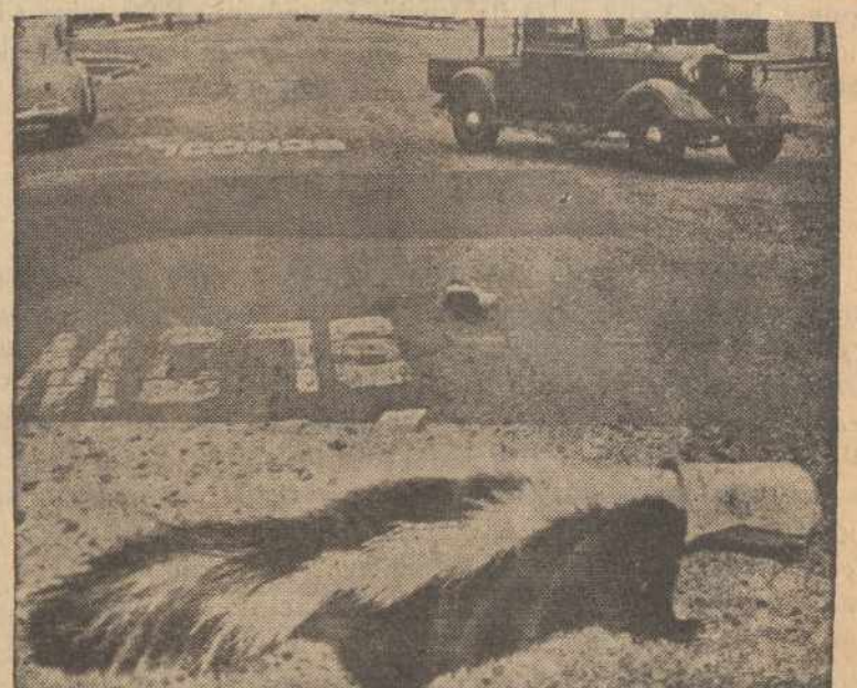
— Laukinis gyvuliukas buvo patekęs į nelaimę, bet išgelbėtas