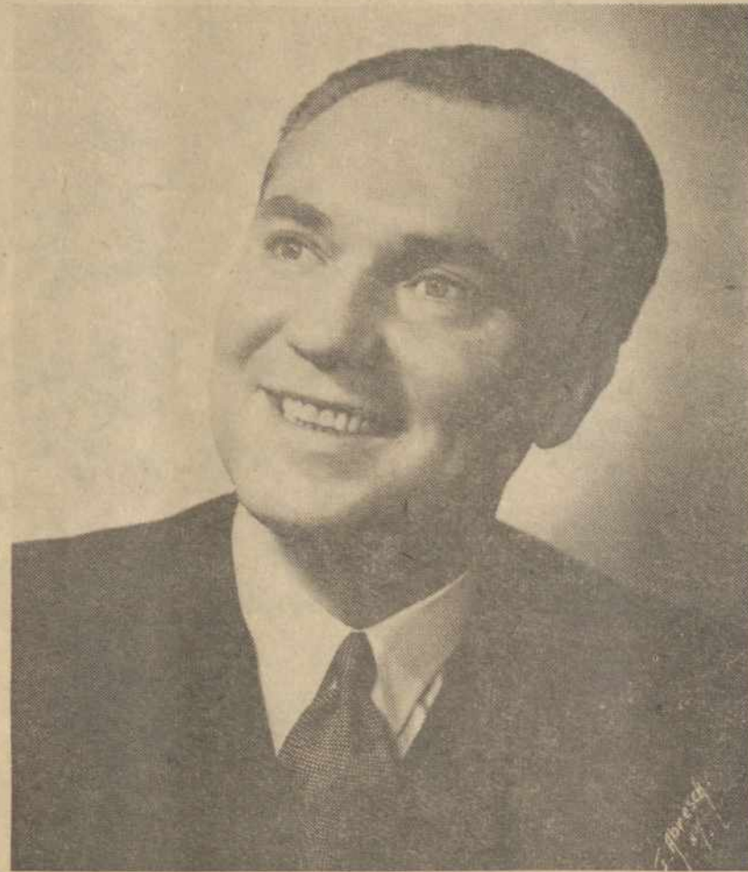
Lietuvos Operos Solistas Ipolitas Nauragis

kuriuo Worcesterio lietuvių visuomenė pagerbs Lietuvos Operos Solistą IPOLITĄ NAURAGI, švenčiantį savo 25-rių metų, scenos darbo sukaktį.