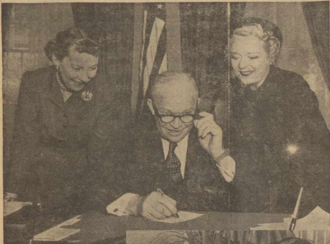
PREZIDENTAS DWIGHT D. EISENHOWER pasirašė kad pirkis boną kas mėnesį, kada Mary Pickford lankėsi sostinėje. Ponia Eisenhower yra Garbės Pirmininkė dėl Moterų Patarimo Komiteto Taupymo Bonams.

Sekant prezidento pavyzdį, Kongreso pirmsėdis Joseph W. Martin taipgi pasirašė pirkt reguliariai boną.