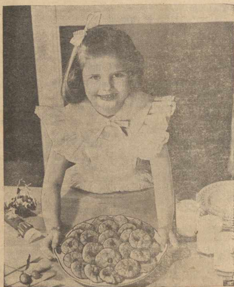
Vaikučiai mėgsta pyragaičius