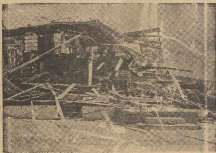
Las Vegas, Nevada. — Čia vaizdas namo, kur buvo 3,500 pėdų nuo A-Bombos paskutinio sproginimo. Siena užsidegė, bet bangos užgesino liepsnas.