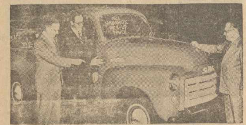
PONTIAC, Mich. — Pirmas GMC "Hydra-matic" sunkvežimias baibtas dirbtuvėje ir trys viršininkai rodo kur ženklai.