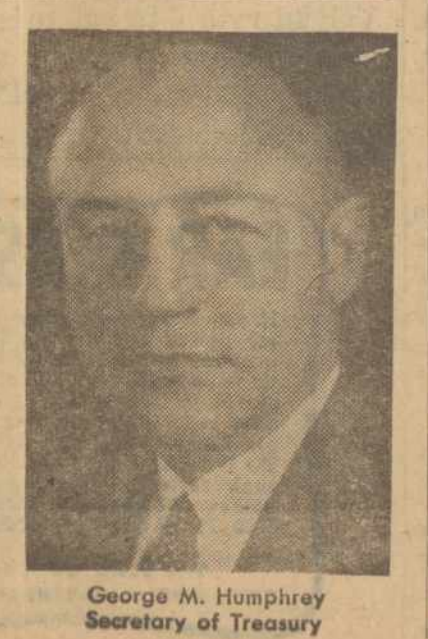
George M. Humphrey Secretary of Treasury

Boston, Mass. — Penkios privatiškos įstaigos, iš kurių keturios priklauso prie Filene's kompanijos siūlė valstybei nemažiau $500,000 pastatyt televizijs stotį, kuri naudot "Channel Two", Bostone. Gubernatorius Herter priimdamas pasiūlymą pareiškė kad jisai tuomi labai patenkintas, nes fondas arčiau priveda prie galimybes, pastatyti ir užlaikyti tokį stotį Massachusetts valstybėje.