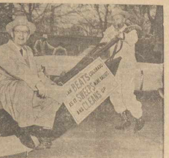
Colorado valstybės gubernatorius Thornton pralaimėjo rinkimų laizybas ir užtai turėjo pavėžyt Utah valst. gubernatorių.

Kloniu atspindžiai mirga — varsuoja, Jaunystės dienos ateitin kyla; Svajonės budriai užimponuoja, Vos gimęs jauties su šviesžia syla.