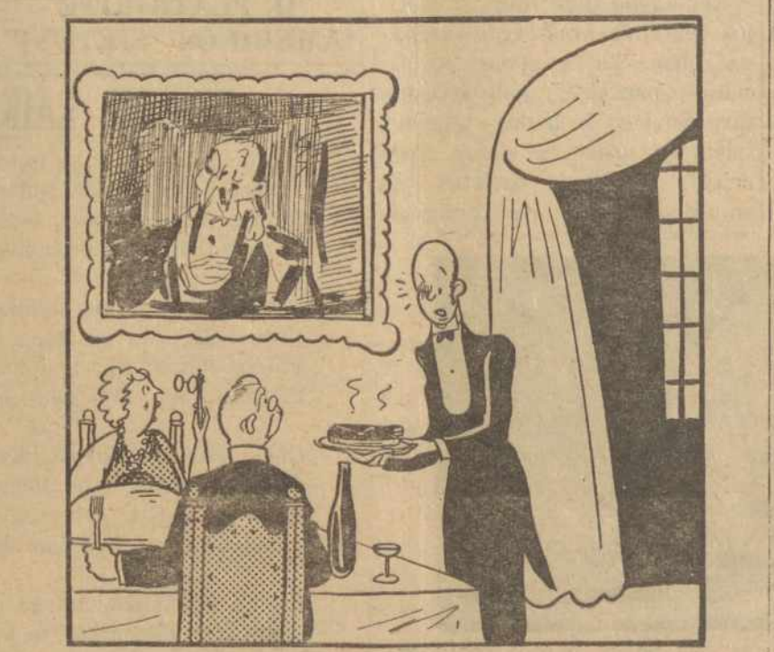
"Atsiprašau, bet ar galėtumėt pasidalyt vieną steiką tarp judviejų — kitas — er sudėgė?"

O visgi JAV surinktos statistinės žinios 1950 m. surašinėjimu gyventojų pagal jų tautybę parodo, kad lietuviams yra užsirašę 484,811; iš šios statistikos matome tikriausiai, arba, artimiausį skaičių mūsų išeivijos žmonių Amerikoje. Ir jei mes galėtume subūrti prie LB nors pusę šio skaičiaus lietuvių, jei nors 200,000 lietuvių apsiungę LB pasiūlytų tautos reikalams, tautinio ir kultūrinio lietuvių gyvenimo išlaikymui Amerikoje, mes tikslu pasiektume. (bus daugiau).