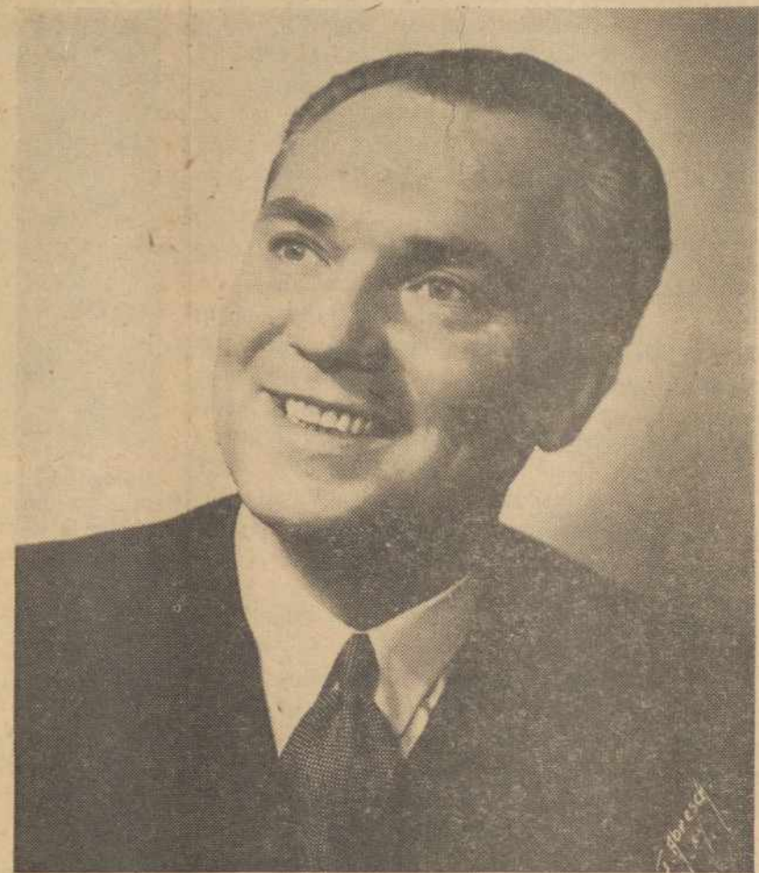
Lietuvos Operos Solistas Ipolitas Nauragis

kuriuo Worcesterio lietuvių visuomenė pagerbs Lietuvos Operos Solistą IPOLITĄ NAURAGĮ, švenčiantį savo 25-rių metų, scenos darbo sukaktį.