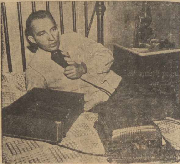
Žymus Dainininkas Bing Crosby keliaudamas tarp Hollywood ir Europą, kalbėjo į savo "Dictaphone" mašiną ir tuomet parašė savo autobiografiją "Call Me Lucky."