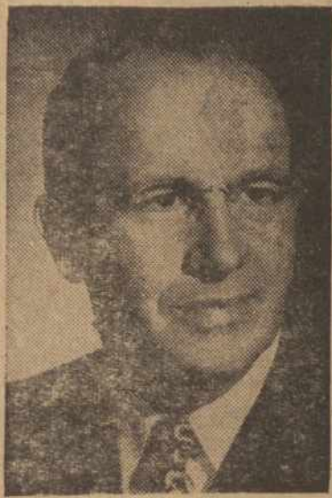
Ezra Taft Benson Secretary of Agriculture