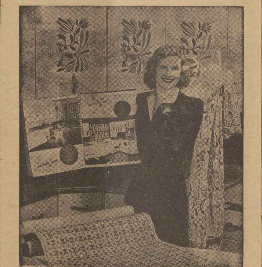
Namų šeiminkės, kurios nori, kad jų virtuvės būtų gražiai papuoštos, gali pasirinkti iš naujausių medžiagų, kurių spalvos suderamos. Yra tos pačios spalvos popierių sienoms ir medžiagos įvairiems kitiems reikalams.

AMERIKOS LIETUVIS 14 VERNON STREET WORCESTER