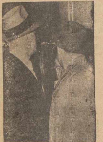
YONKERS, N. Y.—Earl Browder, buvęs komunistų partijos vadovas neleidžia jėgti vienam gydytojui patikrinti jo žmonos sveikatą. Imigracijos Departamentas nori išdeportuoti poną Browder.

Tatai LB kūrėjai jausdami savo pareigas, laikydami sau už garbę būti lietuviams rūpinasi išsprendimu dabarties Lietuvos problemų ir išlaikymu mūsų išeivijos tautinio ir kultūrinio gyvenimo bei sotelkimo užsienių lietuvių jėgų Lietuvos išvadavimui. Tikslai užsienių lietuvių dabar tegali būti Lietuvos vaduotojai. (bus daugiau)