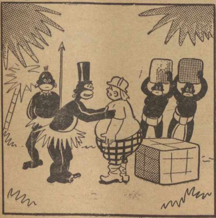
Esi laimingas mano gydytojas sako, kad galiu valgyti tikrai liesą mėsą.

Po kelių dienų vargingos kelionės, dar įkiresnio gerinimosi Vilko, Alvitę atvežė į Vseslavo Vasilkovičiaus valdoma pilį, Polocką, kur ją ir uždarė, kad nepabėgtų. Vargšė mergaitė krintosi patekusi į skaudžią nelaisvę netekdama nuo tokios žiaurios mirties namiškių, dėl to ji aimanavo, šaukėsi Orūno pagalbos, bet niekas neatsakydavo jos šauksmui, niekas neužjausdavo jos skausmų slegiančios širdies. Tikrai Vilkas dažnai lauke pasieny klausydavosi jos raudos nedrįsdamas eit vidun kol neužgijo jos širdyje padarytos dėl namiškių žaisdos. Tuo tarpu ji vito, gelto atskirta nuo žmonių, nuo brangių nužudytų namiškių ir mylimo riterio, kuris gal nei nesužinosias kame ji esanti.