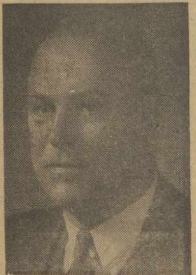
Sinclair Weeks Secretary of Commerce