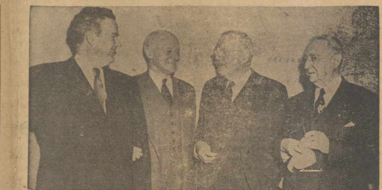
WASHINGTON, D. C. — Valstybės Sekretorius John Foster Dulles prieš Senato Užsienio Reikalų komitetą kalbėjo apie Tolimų Rytų strategiją, kuri pasiliko paslaptimi. Iš kairės: dešinė: senatorius John Sparkman (Ala.) senatorius H. Alexander Smith (N. J.), Sekretorius Dulles, ir senatorius Walter George (Georgia).

Senatorius Carlson, kurs buvo vienas iš prezidento patarėjų laike 1952 m. rinkimų sakė, kad nauja republikonų administracija nuo pat pradžios veikia, kad būtų galima balansuoti federalį budžietą ir sumažinti taksas. Jau Kongresas sumažino vyriausybės išlaidas sausio mėnesį; naujos išlaidos atidėtos pakol nebus patikrintas jų reikalingumas; įrodė savo norą prašalinti išlaidų pinigų eikvojimą.