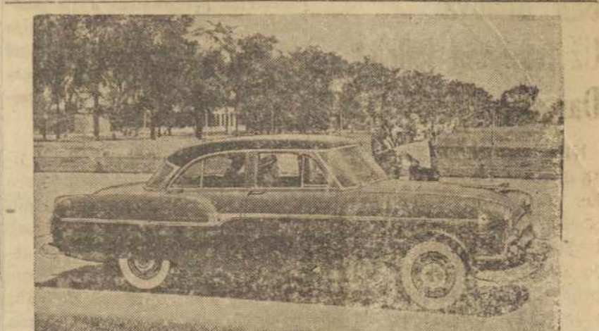
Naujas vidutinės kainos Packard išdirbystės automobilis, vadinamas "Packard Clipper De Luxe, 1953 metų modelis.