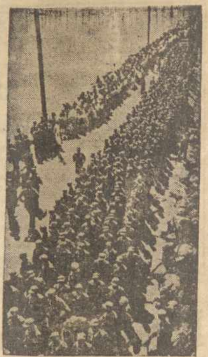
Pietinės Korėjos Armija tapo vėl stipri jėga, aciu amerikiečiams