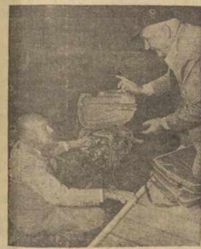
Lauritz Melchior, dainininkas, dešinėje išbando naują motorinį laimelį.

Neplanningo planavimo mašatis prasidėjo tuojuo po karo, kai Raudonoji Armija evakuavo kaimus, miestus, ir net ištisas sritis. Kai rusai susigriebė atstatyti pajūrio sritis, trūko darbo jėgų. Neuzilgo pradėjo plūsti ateiviai iš Gudijos, Ukrainos, Turkestano ir Vidurinės Azijos. Bet naujieji kolonistai irgi sumaišė planavimą, nes nusėdo ne ten, kur buvo numatyti, bet kur jiems patiko. Raudonųjų viešpačių bandymas susitvarkyti iššaukė pasipriešinimą ir net atvirą maštą. Nuo to laiko prasidė-